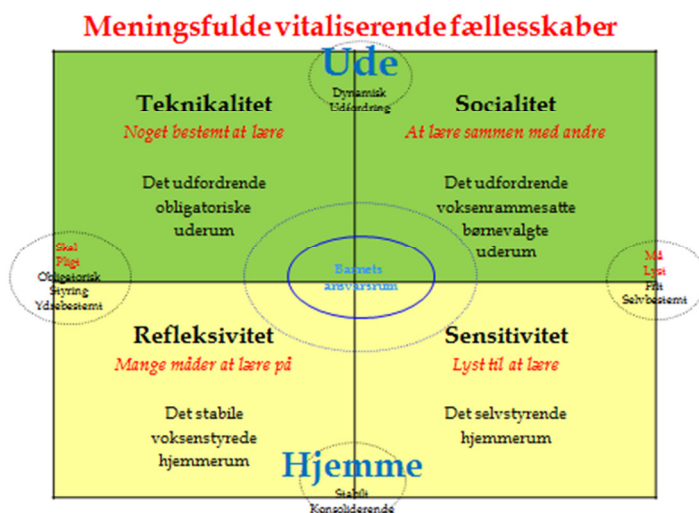
Figur 8. Meningsfulde vitaliserende fællesskaber

Læreprocesser kan i denne forståelse sammenlignes med en uophørlig erfaringsrejse: Mellem at rejse ud i det ukendte for at opdage og lære nyt og at vende hjem til det kendte, hvor der er ro til at integrere den ny erhvervede viden og erkendelse. Nogle gange rejser vi udelukkende styret af lyst, andre gange er vi bestemt af pligt - ofte er vi både styret af lyst og bestemt af pligt.